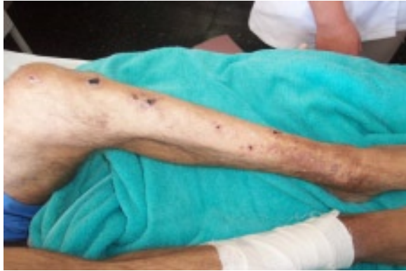
Figura 1. Lesiones eritemato-violáceas múltiples y costras de 1-2 cm de diámetro en región anterior de ambas piernas.

Estudio imagenológico: Radiografía de tórax: Leves irregularidades de hemidiafragma derecho con imágenes reticulonodulares a nivel de base de pulmón derecho.