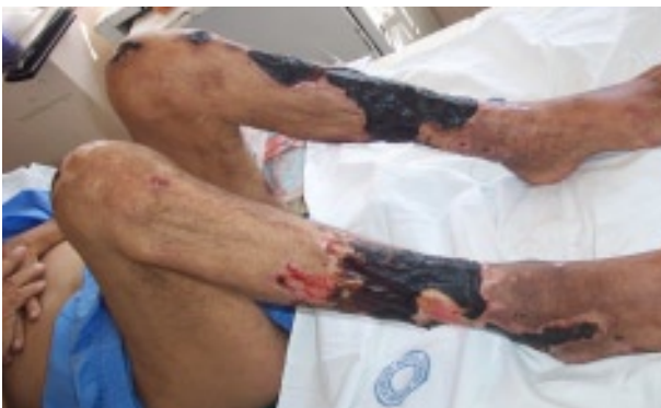
Figura 2. Lesiones necróticas de extremidades inferiores que comprometen gran parte de ambas piernas y muslo izquierdo.

El paciente evolucionó con compromiso del estado general, (CEG), fiebre 39° C, y rápida extensión de las lesiones necróticas de extremidades inferiores, comprometiendo gran parte de ambas piernas y muslo izquierdo (Figura 2).