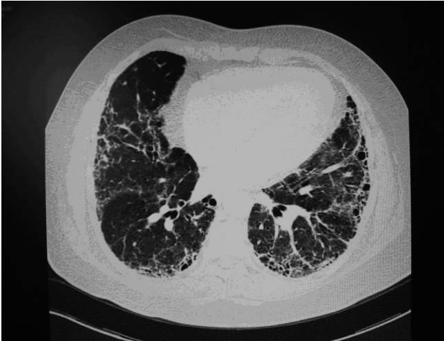
Figura 2. TAC de tórax donde se observa engrosamiento intersticial, con áreas de fibrosis. Además, engrosamiento de los septos inter e intralobulillares.